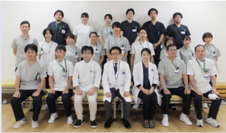
リハビリテーション部スタッフ