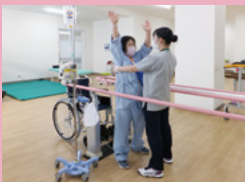
立位バランス訓練