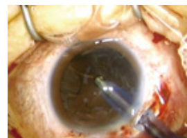
白内障手術の様子。

当院では本年5月より局所麻酔専用の手術室が開設、運用が開始されました。現在は入院患者を対象に主に白内障手術を行っており、現在日帰り手術を開始する準備を進めています。さらに眼科に加え、他の外科系を中心とした診療科での活用も検討しています。局所麻酔手術室の開設は、手術数の増加、手術待ち時間の短縮、病棟や中央手術室の活用の更なる効率化、活性化などに繋がると考えられます。これらによってこれまで以上に地域の中核病院として患者さんに適切な医療を迅速に提供できることが期待されます。