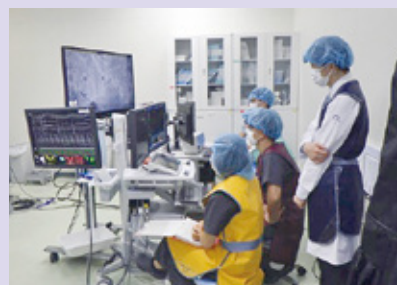
アブレーション時の周辺機器は臨床工学技士が担当。