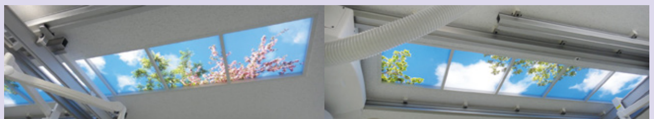
天井の風景画。無機質な天井を検査中眺めているのは苦痛という患者さんからの声を伺い、検査・治療中の環境を整えました。