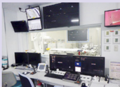
緊急検査への対応、不整脈治療など、多職種でチームを組んで対応。