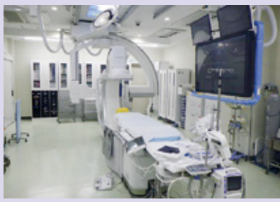
2方向からのカテーテルの確認が可能な多目的血管撮影装置。