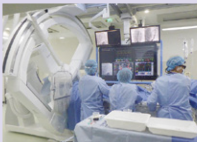
不整脈治療のためのカテーテルアブレーション。

最先端の治療に対応できる装置と周辺機器を整備することで幅広い症例に対して診療を提供可能となりました。今後とも最新の診療に安全に対応できるシステムとして、活躍が期待できる装置です。