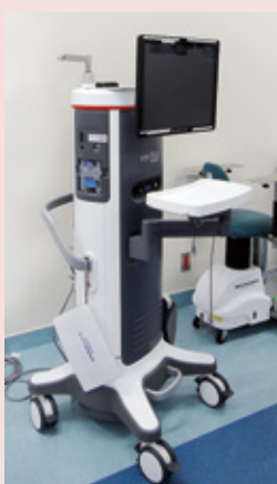
最新の白内障手術装置。