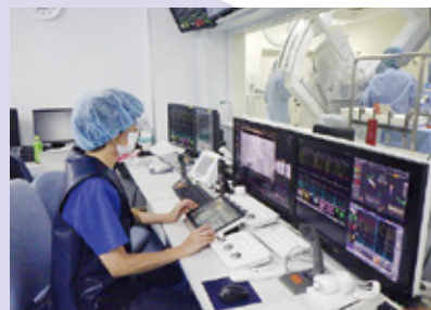
X線装置の操作、被ばくの管理、最適な画像の表示は診療放射線技師が担当。