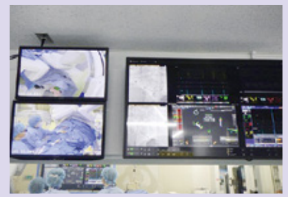
アブレーション中の情報は画面にて表示可能。