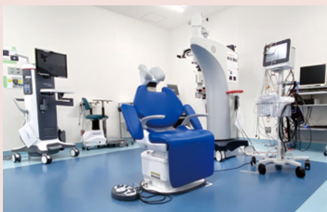
手術室全景：中央手術室とほぼ同じ機能を有する。