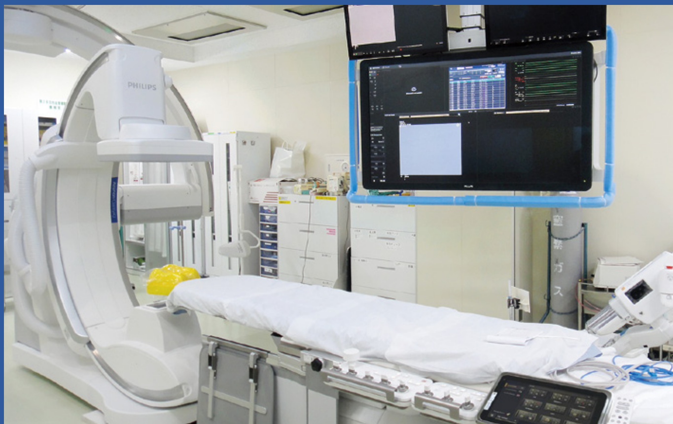
新設した眼科局所麻酔手術室(上)、血管造影室(下)