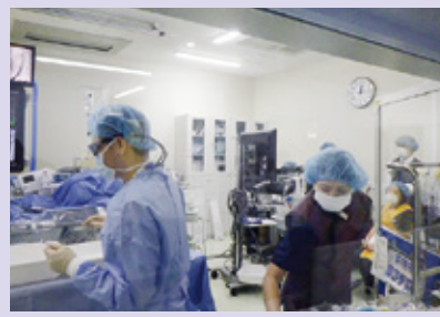
治療中の患者さんに寄り添う看護師。