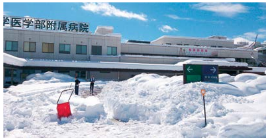
降雪から一夜明けた2月15日の風景

最後に、除雪に参加していただいた近隣の教職員の皆様、学生の皆様、そして山梨県の要請により北富士駐屯地から駆け付けてくださった陸上自衛隊第1特科隊の皆様には、心から感謝申し上げます。