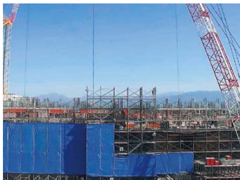
新病棟建設工事の状況（5月2日現在）

のと思われまます。極力、騒音や振動が発生しないように取り組みまます、診療への影響が大きい場合には病院経営企画室担当までご連絡をお願いいたします。また、新病棟の建設内容確認のため、院内スタッフの皆様にはお時間をいただくことが今後も多くあるかと存じまます、より良い病院とするため、引き続きご協力の程、何卒よろしくお願い申し上げます。