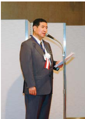
第17回世界心臓胸部外科学会 会頭挨拶(平成19年京都)

れました。そして、誰からも信頼され、敬愛されてきました。優しく、時には厳しく御指導を受けた私たち医局員は、先生のあまりに早い御逝去に接し、無念の涙を禁じ得ません。ここに医局員を代表して深甚なる感謝の意をお伝えするとともに、これから各自が先生のお教えを継承、発展させていくことをお誓い申し上げます。御冥福を心よりお祈りいたします。