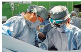
医局員に対する手術指導