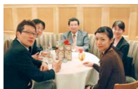
インドへの学会出張にて 医局員と地酒で乾杯