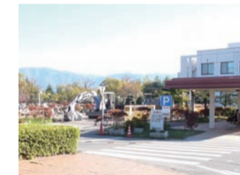
病院正門より見た出店地