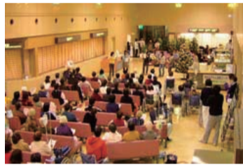
昨年のコンサートの様子

日時 平成18年12月21日(木)午後6時~7時15分 会場 本院正面玄関ロビー 演奏者 医学部交響楽団(学生オーケストラ) 甲府室内合奏団 看護部4階西病棟ハンドベル部