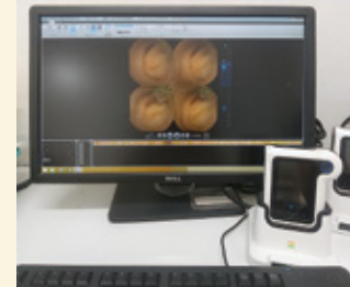
カプセル内視鏡ワークステーション