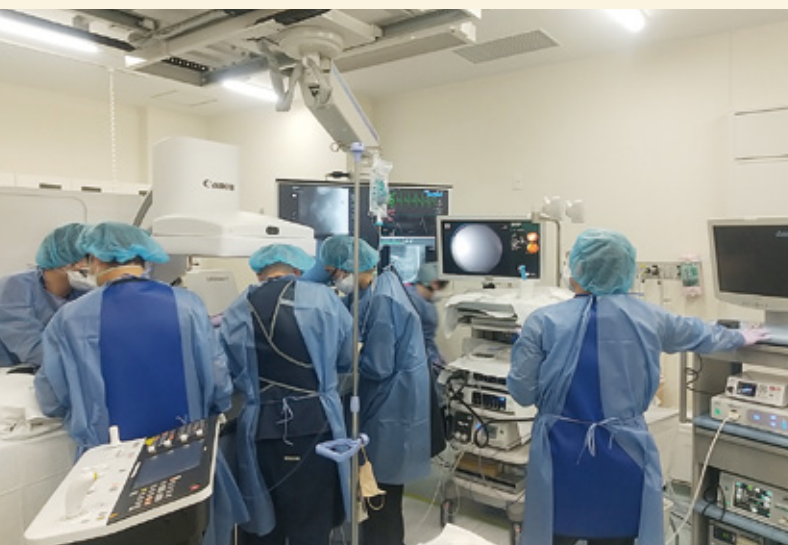
X線透視室での処置の様子