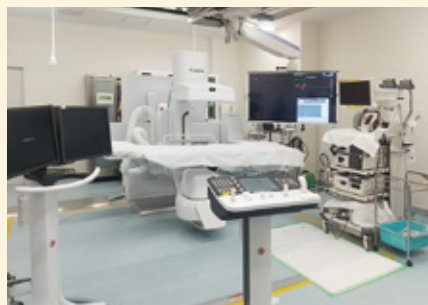
X線透視室は最新の機械で被ばく量を低減