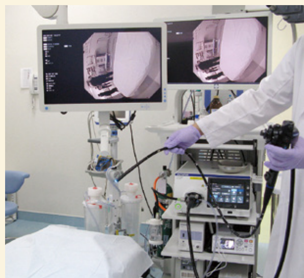
最新の内視鏡システムに無停電電源装置を設置