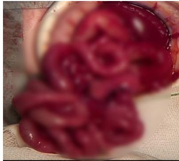
小腸閉鎖の新生児手術