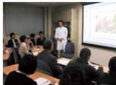
肝臓病教室の様子

肝炎は国民最大級の感染症と位置づけられており、肝癌とも密接に関連することから、この疾患克服は重要かつ喫緊の課題とされています。本センターは、全国でも先進的な施設として注目されており、皆様方のご協力のもと発展させていきたいと思っております。今後ともよろしくようお願いいたします。