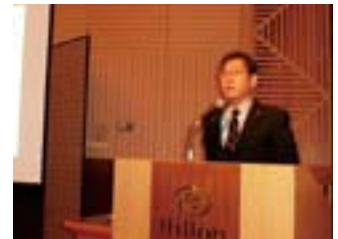
報告を行う板倉センター長