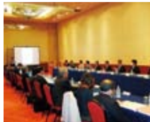
最終事業報告会の様子

最後に、この事業にご理解ご協力をいただいた多くの先生方、職員の方々に心より御礼申し上げますとともに、引き続き5大学連携にご理解いただけますようお願いいたします。