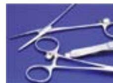
RFIDタグの取り付けられた鉗子等

以上、多くのメリットを期待できるシステムですが、繊細な手術器械に直径6mmのRFIDを取り付けることになり、取り付け場所の確認など、各診療科の協力がなくてはとて成し得るものではありません。また、マスター作成等については手術部看護師の協力が必須となります。関係の皆様のご協力をお願い申し上げます。