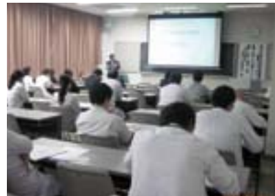
信州大学との共催により実施したセミナーには多くの医師が参加しました。