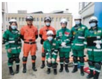
研修参加メンバー (緑色の隊員服)

災害は、いつ起こるか分かりません。病院内でも日頃から災害被害を最小限に押さえるために対策を行うことが大切であると感じます。先に研修へ参加した DMAT 隊員と協力し、準備を整えとともに、今後も継続して研修に参加して知識・技術を習得していきたいと思えます。