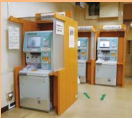
更新された診療費自動支払機

なお、自己負担金のない(領収書のない)患者さん、または、過去分の領収明細書発行を希望する患者さんについては、医事課④番計算受付窓口で申込みをしていただくことで、当日発行いたします。やむを得ず当日発行できない場合は、次回ご来院日等を確認のうえ、後日発行いたします。ご協力をお願いいたします。