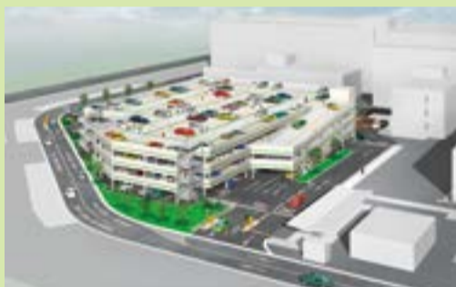
病院駐車場完成予想図

しますと平面の駐車スペースと併せ、約600台の車両を駐車することが可能になります。また、災害発生時等、緊急時には駐車場の一部を屋外臨時診察スペースとして利用できる仕組みを取り入れています。完成は平成26年3月で、4月から運用を開始する予定です。