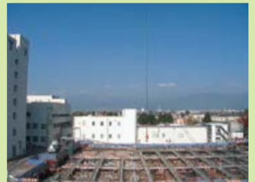
新病棟建設工事の状況 (平成25年11月18日現在)

を行っております。この作業終了後に建物自体の建設に取りかかります。新病棟が地上に姿を現してくるのは年明けになる見込みです。駐車場・新病棟ともに工事期間中は皆様にご不便、また、騒音等ご迷惑をお掛けいたしますが、患者さんの療養環境の更なる充実を目指して取り組みますので、ご理解とご協力をお願い申し上げます。