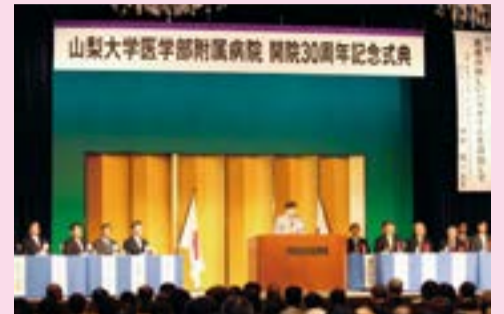
開院30周年記念式典の様子